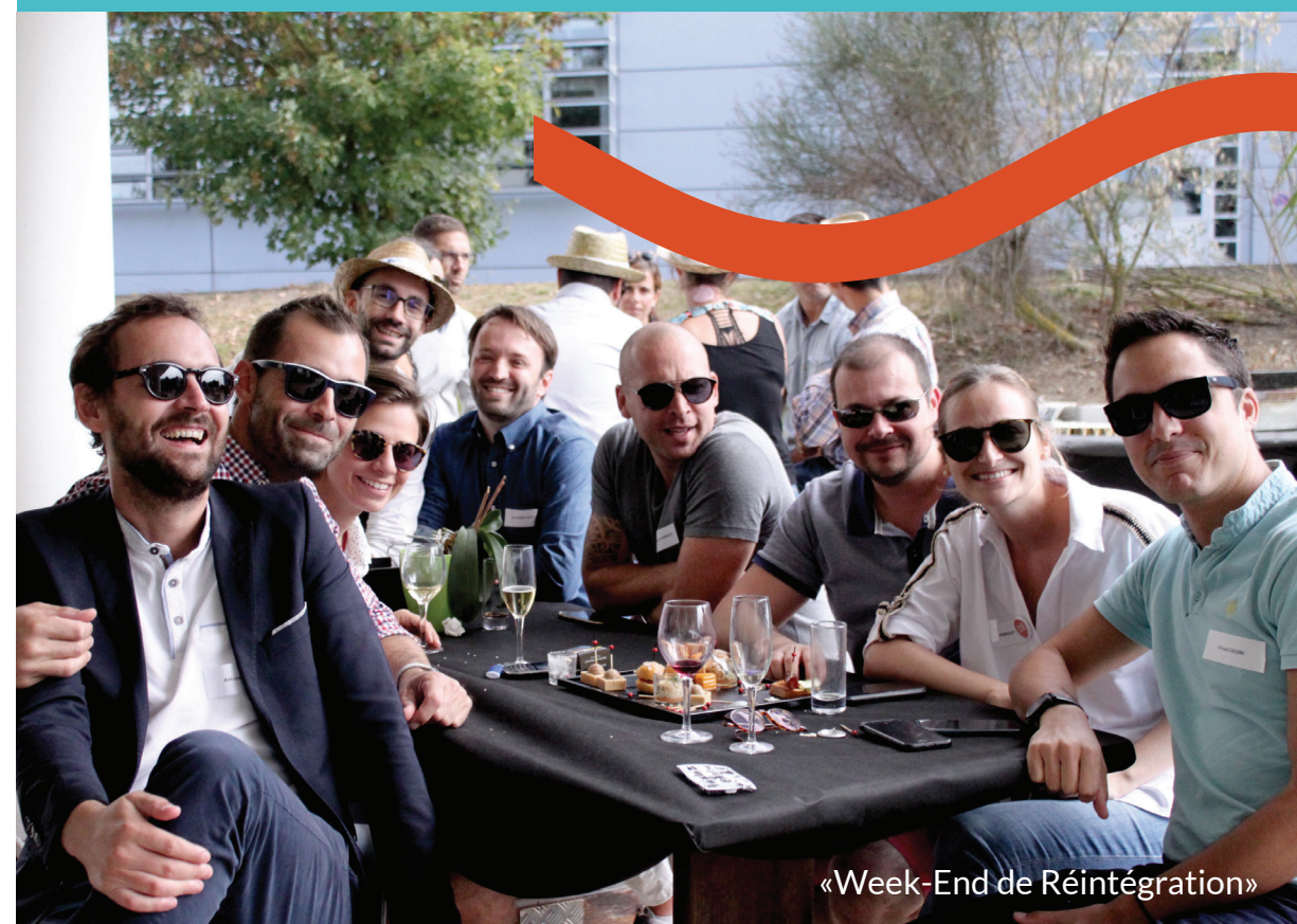
«Week-End de Réintégration»